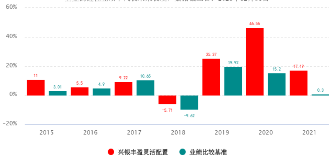
基金的过往业绩不代表未来表现，数据截止日：2021年12月31日

注：业绩表现截止日期 2021 年 12 月 31 日。基金过往业绩不代表未来表现。