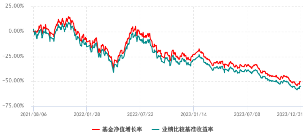
基金份额累计净值增长率与同期业绩比较基准收益率历史走势对比图 (2021年08月06日-2023年12月31日)

注：1、本基金成立于 2021 年 8 月 6 日；2、比较基准：国证新能源车电池指数收益率。