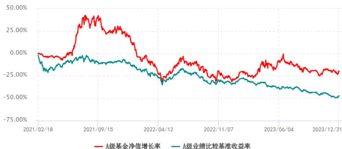
A 级基金份额累计净值增长率与同期业绩比较基准收益率历史走势对比图 (2021 年 02 月 18 日-2023 年 12 月 31 日)