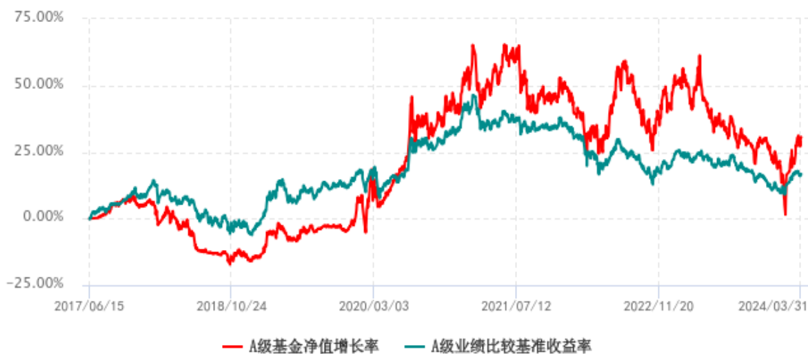
A 级基金份额累计净值增长率与同期业绩比较基准收益率历史走势对比图 (2017年06月15日-2024年03月31日)